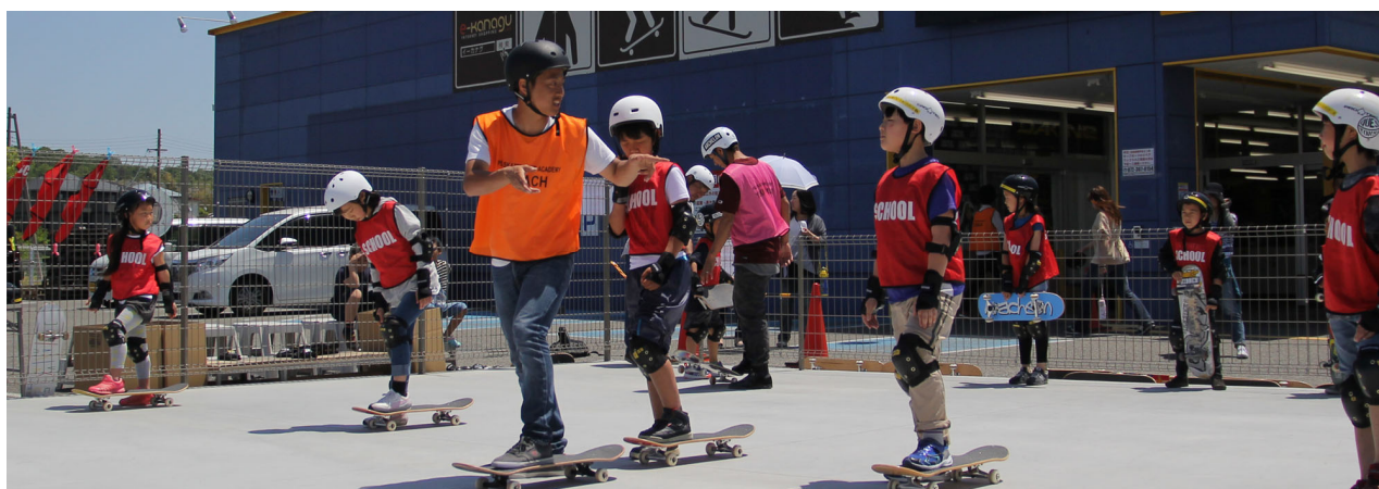
定期的に開催している無料体験会の様子