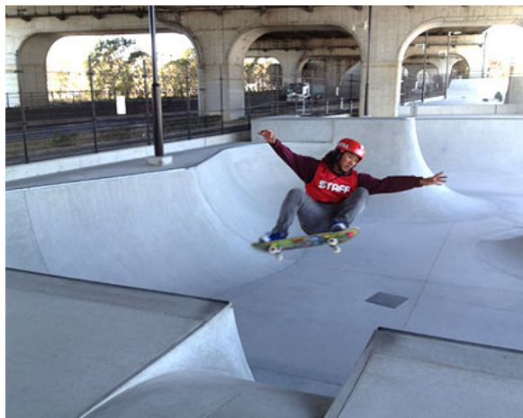
原池公園スケートパーク